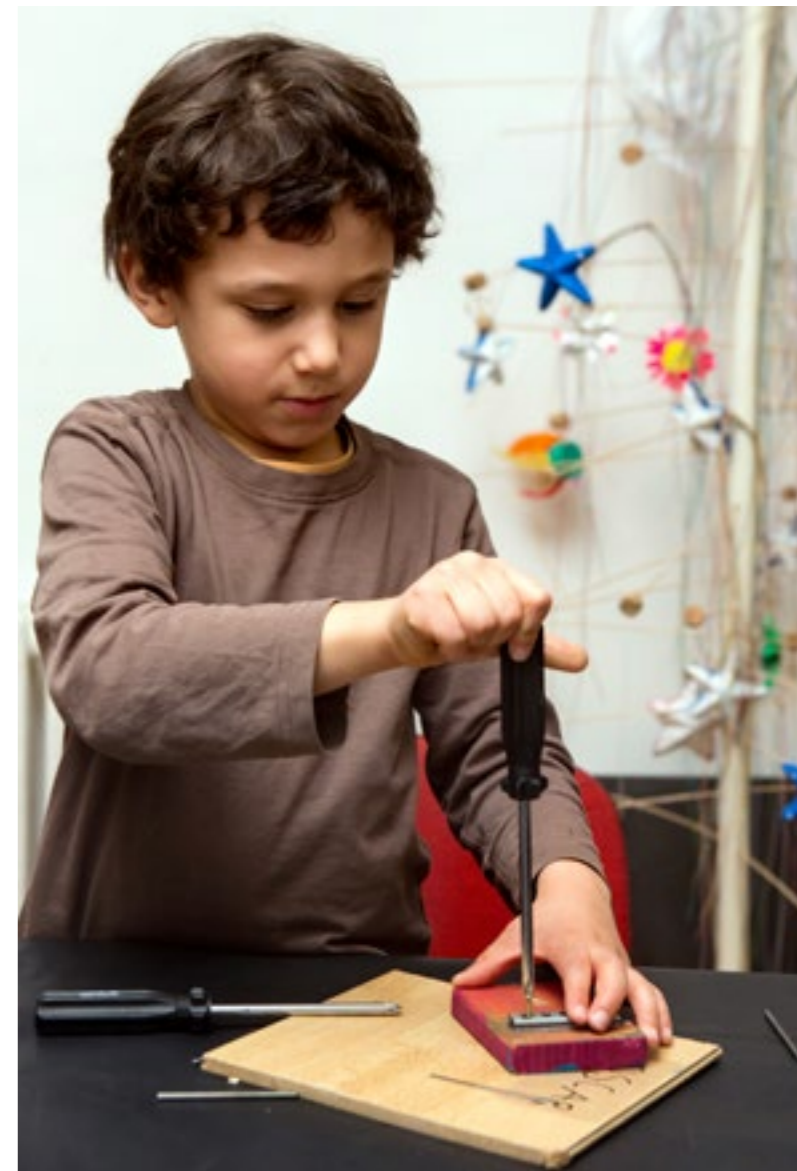
Pile dans la tendance écolo, l'association Talacatak propose des ateliers aux enfants pour fabriquer des instruments de musique recyclés. Place à la créativité !

Chez Talacatak, dans le XIX e arrondissement de Paris, les bouteilles en plastique, les morceaux de carton et les bouts de bois retrouvent une deuxième vie. Ils se métamorphosent en instruments de musique sous les doigts agiles des tout-petits. Magique ! Dans l'atelier, les étagères sont pleines de trésors en tous genres : tuyaux, pots de crackers, boîtes à œufs, pailles, bouchons, capsules... Autant d'objets de récup' qui permettent de créer des ➤